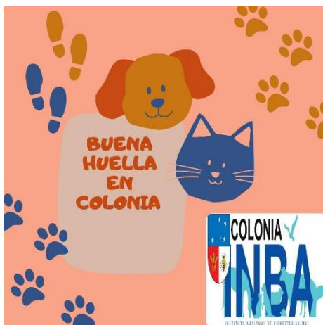
Logo creado para identificar el proyecto