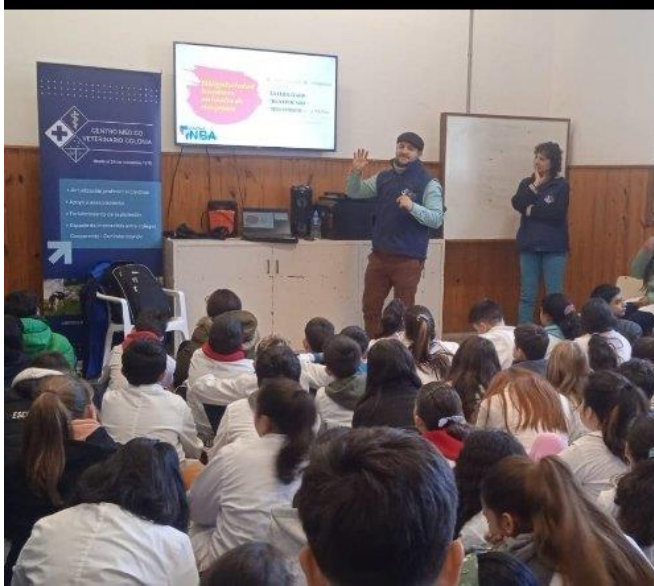
Registro fotográfico del proyecto en acción (escuela urbana de Juan Lacaze)